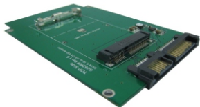
AD963FA5 for full size mSATA SSD